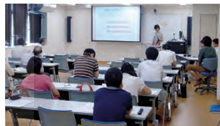
修士課程 メディカルゲノム中間発表会（2012年9月）