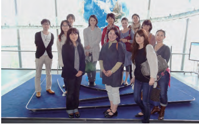
日本科学未来館にて（2012年10月）