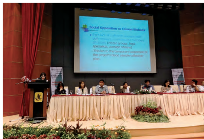
13th Asian Bioethics Conference（マレーシア・クアラルンプール）

台湾の事例からは、政策者、科学者、社会の間のコミュニケーション不足によってバイオバンクの意義が充分理解されないまま、科学政策が先行することが窺えます。一方で、コミュニケーションが取れていないからこそ、国民のバイオバンク作りへの高い支持率が得られたかもしれません。バイオバンクの話題を通して国家科学政策と国民の参加や意思形成の課題を考えさせられました。（張）