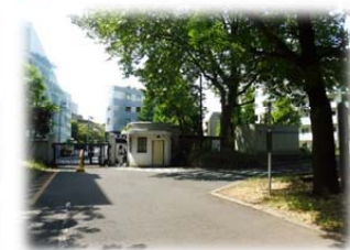
④ 奥に西門が見えます。門の手前で右にお曲がりください。