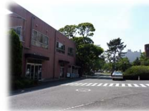
③ 左手に白金ホール (生協食堂・購買部) を見ながら前進してください。