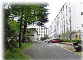
▲センター遠景(奥正面)