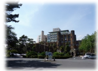
② 右手には1号館が見えます。