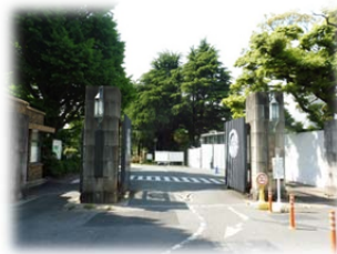
① 正門より構内へ入ります。