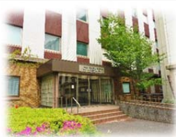
▲センター近景(入り口)

※ ヒトゲノム解析センターの入館は指紋認証で管理されておりますので、ご来室の際はセンター入り口の電話で公共政策研究分野(内線 72079)までご連絡ください。解錠いたしますのでエレベーターで3階までお上がりください。